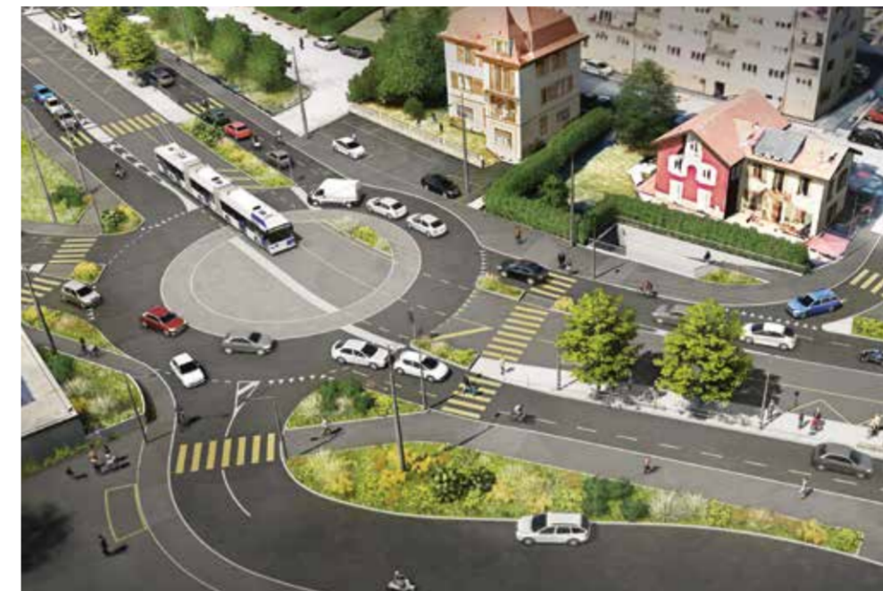
Modélisation du futur carrefour du Grand Pont à Lutry © Urbaplan

Alors que l'Est lausannois attire davantage d'habitants chaque année, la mobilité durable représente un enjeu collectif crucial pour le développement de la région. Avec ses cinq gares et plus d'une dizaine de lignes de bus, le secteur est relativement bien desservi en transports publics. Toutefois, pour pouvoir se déplacer de manière fluide et confortable sur l'axe qui relie Lavaux au centre de Lausanne, de nouvelles infrastructures sont nécessaires. Pour répondre à ce défi de taille, les communes de l'agglomération lausannoise, en collaboration avec le PALM, ont conçu un projet ambitieux pour la mobilité de demain : le BHNS, pour « bus à haut niveau de service ». Rassemblant les communes de Pully, Paudex et Lutry, l'aménagement pour le passage de ces bus ultra performants constitue l'un des projets phares du SDEL.