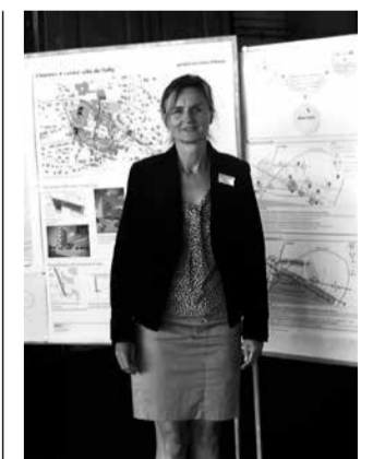
Pascale Seggin © SDEL

Et dans l'Est lausannois ? La région dispose d'importantes réserves en zones à bâtir d'habitation et mixtes qui devront être mobilisées. En revanche, dans certains cas, la valeur patrimoniale naturelle ou bâtie pourrait justifier une non-mobilisation de ce potentiel. Le SDEL, tant au niveau politique que technique, a entamé des réflexions dans ce domaine.