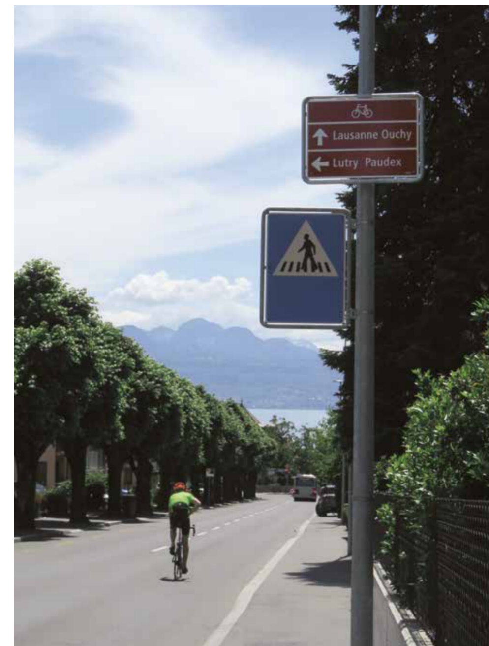
L'un des 850 panneaux directionnels fraîchement posés, ici à l'av. de Villardin à Pully.

De Lutry à Morges, en passant par les rives du lac, notre région recèle de superbes itinéraires pour vélos. Encore faut-il savoir par où passer ! Pour orienter les cyclistes et faciliter leurs trajets quotidiens, les communes du projet d'agglomération Lausanne-Morges (PALM) ont entrepris d'équiper l'entier du territoire de l'agglomération de panneaux directionnels. En maître d'ouvrage délégué, le Canton de Vaud collabore étroitement avec les Schémas directeurs et les communes pour la réalisation de ce projet. À terme, ce sont plusieurs centaines d'écriteaux qui guideront les utilisateurs de la petite reine.