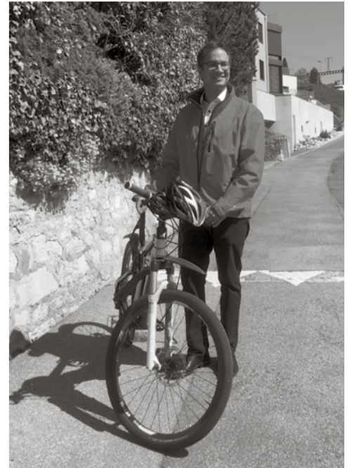
Fabian Schwab © DGMR

L'une des particularités de ce projet est que les communes ont accepté de déléguer sa mise en œuvre au Canton, pour assurer sa cohérence sur l'ensemble du territoire de l'agglomération. Centraliser ainsi l'organisation a permis de faciliter les démarches, notamment pour les demandes de subventions. Les Schémas directeurs ont joué un rôle important, en permettant de limiter le nombre d'interlocuteurs tout en assurant le relais entre le Canton et les communes. Somme toute, une affaire qui roule !