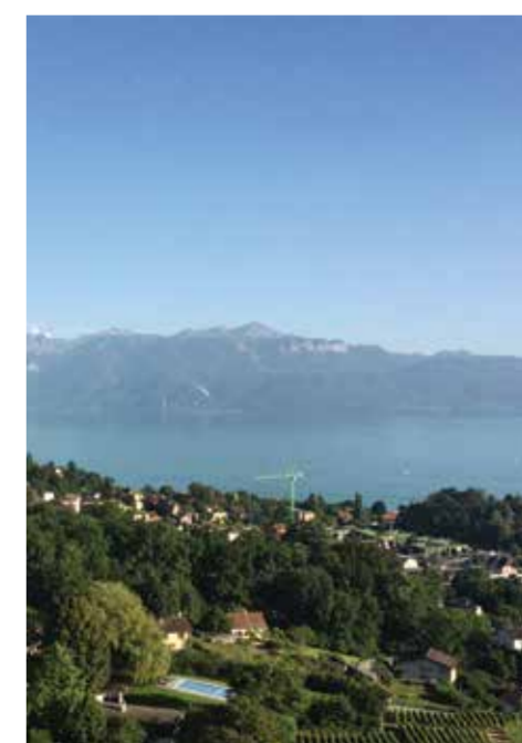
Coup d'œil depuis le quartier de Corsy-La Conversion

La troisième phase du projet, qui consiste à élaborer un concept de synthèse et à planifier la mise en œuvre, est en cours. Cette étude devrait être validée à l'automne 2020, ce qui nous rapproche toujours un peu plus du premier coup de pioche tant attendu.