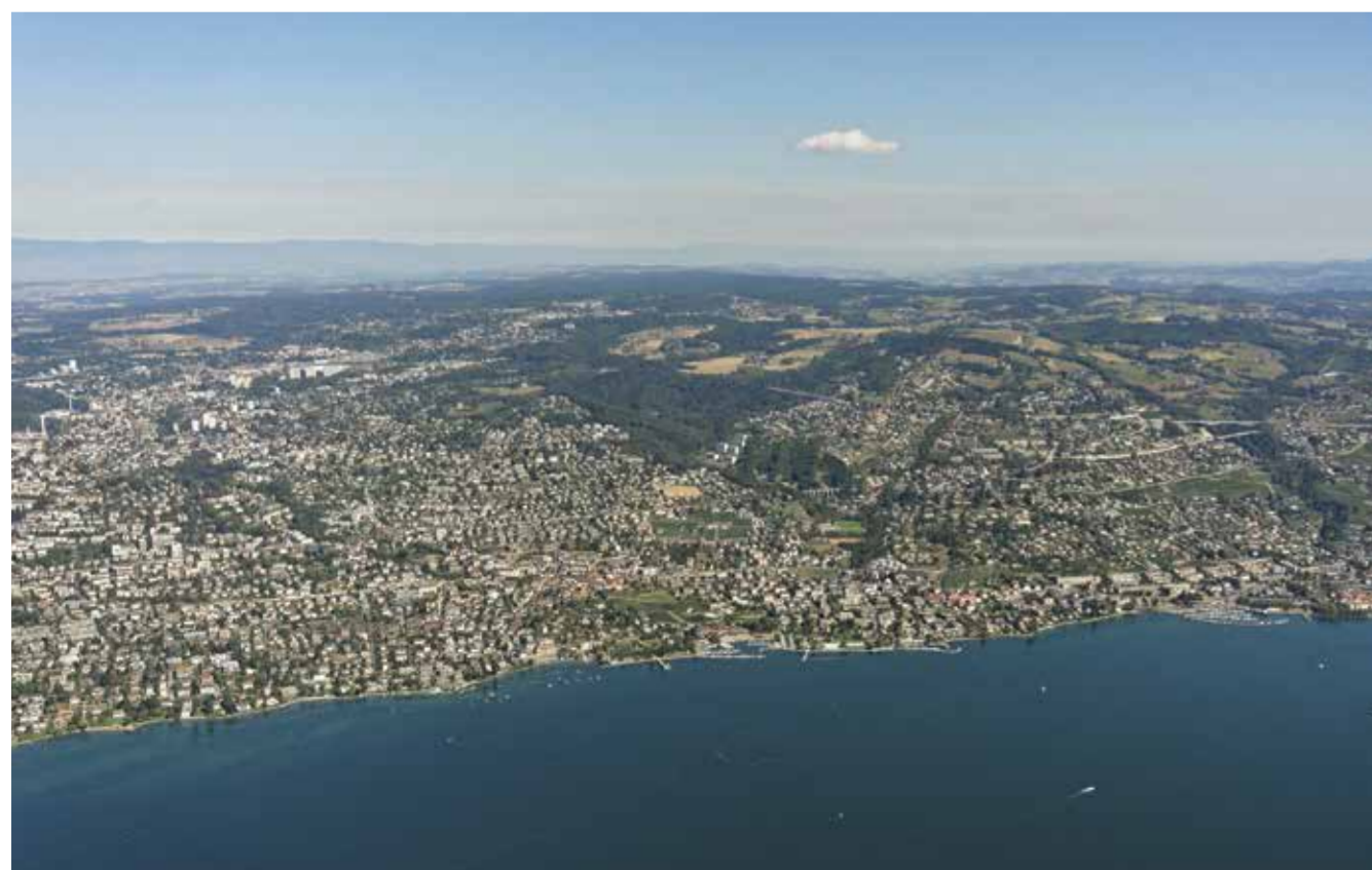
L'Est lausannois vu du ciel

Le point commun entre tous ces projets ? Un modèle durable d'urbanisation appelé « ville des courtes distances ». Convaincus de la nécessité de repenser notre consommation énergétique et de préserver nos espaces verts, nous devons réinventer notre rapport aux territoires urbains et nos manières de les concevoir. Comment ? En créant des quartiers multifonctionnels, qui favorisent la marche et le cyclisme, et qui sont reliés par un réseau de transports publics dense et efficace. Depuis dix ans, nous nous engageons pour que ce modèle devienne une évidence dans l'Est lausannois. Et grâce à une collaboration forte, il devient petit à petit, projet par projet, une réalité.