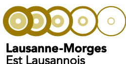
Schéma directeur Est lausannois Chemin du Closel 15 Case postale 129 1020 Renens 1

Pascale Seghin Cheffe de Projet Tél : +41 21 621 08 50 E-mail : pascale.seghin@palm-vd.ch